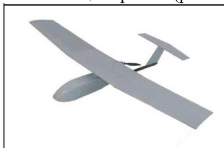
Рис. № 6 – БПЛА самолетного типа.

Существуют БПЛА, предназначенные для выполнения задач РЭР, РЭБ и связи. Скоростной диапазон работы – от 15 до 30 м/с. Рабочие высоты – в зависимости от оборудования и размеров аппарата, но всегда превышают 300 м. Обычно это диапазон высот 300 – 2000 м. Существует несколько аэродинамических схем самолетных БПЛА. Основные аэродинамические схемы – классическая (рис. № 6) и «летающее крыло» (рис. № 7).