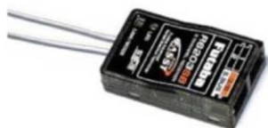
Рис. № 11 – Приемник аппаратуры управления.

Видеопередатчик (рис. № 10) – это устройство, передающее на наземную станцию изображение с камер БПЛА. Является самым заметным устройством на борту БПЛА, поэтому без необходимости включать его не стоит (это касается только тех БПЛА, которые хранят фотографии на борту), соблюдая режим радиомолчания. Такой режим уменьшает возможность применения противником средств РЭБ.