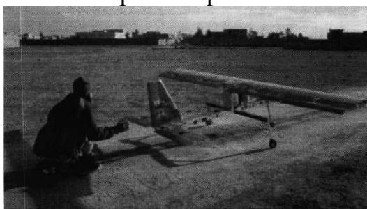
Рис. № 4 – малогабаритный летательный аппарат.

БВС-камикадзе является весьма специфичным классом беспилотной техники, информация о котором чаще всего носит секретный характер. Такой дрон представляет собой малогабаритный летательный аппарат (рис. № 4), способный нести несколько килограмм взрывчатки.