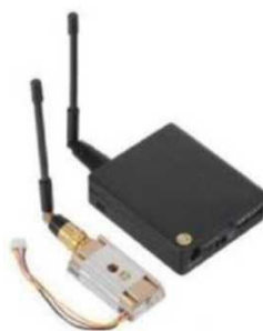
Рис. № 10 – Видеопередатчик.

Видеопередатчик (рис. № 10) – это устройство, передающее на наземную станцию изображение с камер БПЛА. Является самым заметным устройством на борту БПЛА, поэтому без необходимости включать его не стоит (это касается только тех БПЛА, которые хранят фотографии на борту), соблюдая режим радиомолчания. Такой режим уменьшает возможность применения противником средств РЭБ.