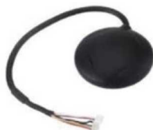
Рис. № 8 – Модуль GPS-навигации.

Рассмотрим радиопередающие системы, установленные на БПЛА.