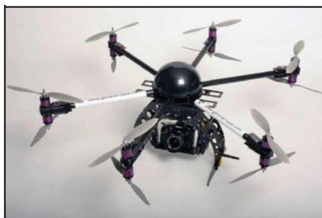
Рис. № 5 – многомоторный БПЛА.

Тип БПЛА, который с каждым днем получают все большее распространение, – многороторные системы. Их еще называют мультикоптерами, квадрокоптерами, гексакоптерами, октакоптерами и тому подобное, в зависимости от количества несущих винтов. Характерная особенность – многомоторная система, принцип полета – подобен вертолетному (рис. № 5).