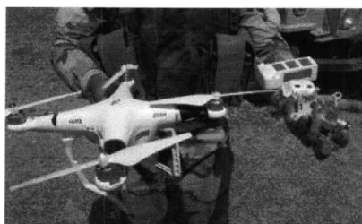
Рис. № 1 – БВС вертолетного типа.

Для совершения диверсионных актов могут использоваться БВС самолетного и вертолетного типа (рис. № 1) кустарного производства, причем доля последних значительно превышает количество самолётных. Объясняется это в первую очередь их более низкой стоимостью.