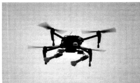
Рис. № 3 – квадрокоптер.

На квадрокоптерах также изменяется система управления камерой таким образом, чтобы над целью вытягивать леску и высвободить гранату. Корпус, может быть, пластмассовый и снабжен небольшим количеством поражающих элементов. Основу для самодельных бомб могут составить переделанные фабричные боеприпасы. Например, выстрелы ВОГ-17А и ВОГ-17М. Также используются безгильзовые гранаты ВОГ-25. Взрыв ВОГ сравним со взрывом ручной гранаты РГД-5. При взрыве ВОГ-25 образуется большая масса мелких осколков, которые обеспечивают сплошное покрытие осколками в радиусе 10 метров. При таком взрыве все не защищенные участки тела поражаются осколками.