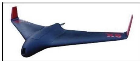
Рис. № 7 – БПЛА тип «летающее крыло».